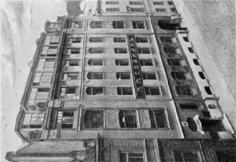
Фасад входил формы П. П. Соёмки